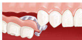
Insertion de la prothèse à châssis métallique