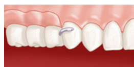
Prothèse en place